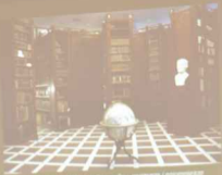
Exemplarj Regulej, Jura Dorotheuski - regulacja i regulacja kolekcji bibliotecznej Regionalny Regionalny

Detal z Ordoalka, Dorotheuski zwanego regulacji wazy jako historyj Regionalny Institutej Regionalny